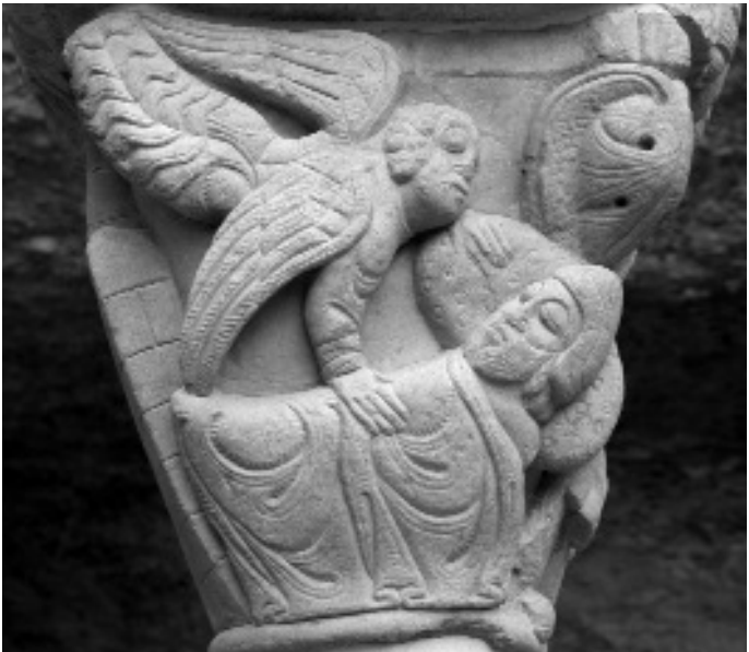
Der Engel erscheint Joseph im Traum, Kapitell in San Juan de la Peña.

Im Tympanon des Portals, einer Imitation von Jaca, sehen wir ein roh zugehauenes Chrismon mit acht Halbkreisen, von zwei stilisierten Löwen flankiert. Der rechte hat unter seinem Körper eine Blume mit zwölf Blättern, in der einige Autoren die symbolische Darstellung eines margaritum (eine Reliquie mit Holz vom Kreuz Christi) sehen, eine Auffassung, die durch den Namen des ursprünglichen Benediktinerklosters und des heutigen Dorfes, Santa Cruz, unterstützt wird.