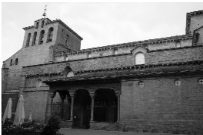
Kathedrale von Jaca. Hinter der Säulenhalle am Südportal befindet sich das Maß für die „aragonesische Elle“.

Sehenswert ist auch das Fest der Moros y Christianos (Mauren und Christen), das am ersten Freitag im Mai mit einer Prozession zu Nuestra Señora de la Victoria (Unserer Frau vom Sieg) gefeiert wird. Daran nehmen Mädchen teil, die häusliches Werkzeug (Spinnrocken und Spindeln) schwingen, gemäß der Überlieferung wichtige Waffen im ersten Widerstand der christlichen Pyrenäenbevölkerung. Am selben Tag führen die Burschen am Nachmittag vor der Kathedrale eine Scheinschlacht auf.