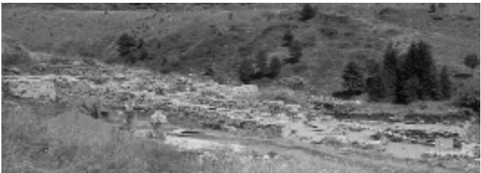
Ausgrabungen an der Herberge der Heiligen Christina.