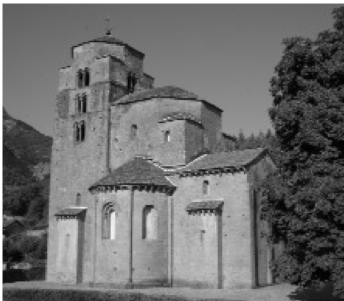
Santa María in Santa Cruz de la Serós birgt eine romanische Turmkammer.

Das Äußere der Kirche bietet eine Fülle von Kapitellabschlüssen mit symbolischen und tierischen Skulpturen (Hunde, Affen, Fische, Salamander etc.), doch das Erstaunlichste der Anlage ist die obere Turmkammer.