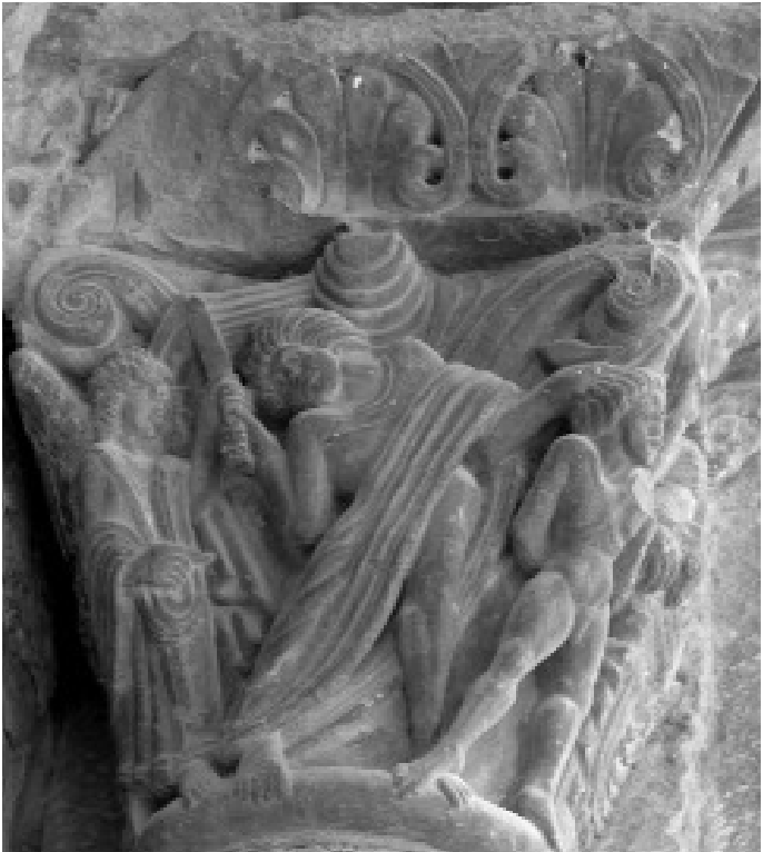
Bestechende romanische Nacktheit: Isaak auf dem Berg Moria, Kathedrale in Jaca.

In derselben Kathedrale, im dortigen Museum, sollte man die romanische Gemäldesammlung besuchen, wahrscheinlich die beste ihrer Art in Europa, und an der rechten Seite des Südportals das Halbreief betrachten, welches das alte Maß der aragonesischen Elle vorgibt.