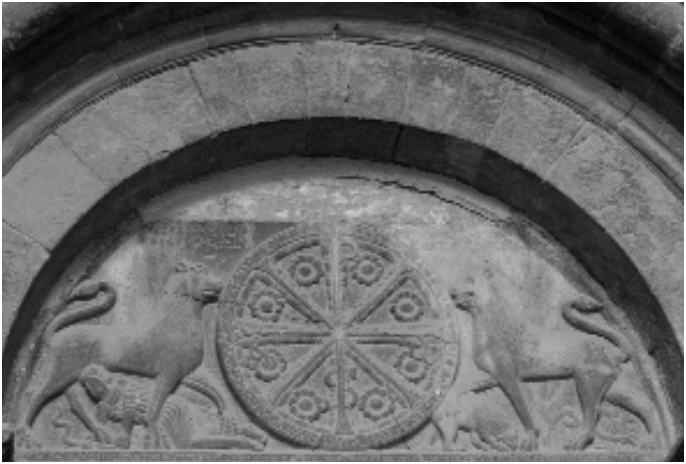
Chrismon auf dem Tympanon des Westportals der Kathedrale von Jaca.

abschließenden Simsleiste, die gegliederte Steinornamentik, die Rollen in den Säulenrillen, den Glockenturm, die mit den beliebten Karomustern geschmückten Zierleisten der Kränze und Kranzgesimse (jakobinisches Schachbrettmuster). Vor allem aber geht das Chrismon auf sie zurück, das in einem steinernen Kreis erscheinende Christusmonogramm, das von immer mehr Autoren als ein untrügliches Erkennungszeichen der Jakobslogen untereinander angesehen wird und als solches auf dem Camino Francés außergewöhnlich häufig erblüht.