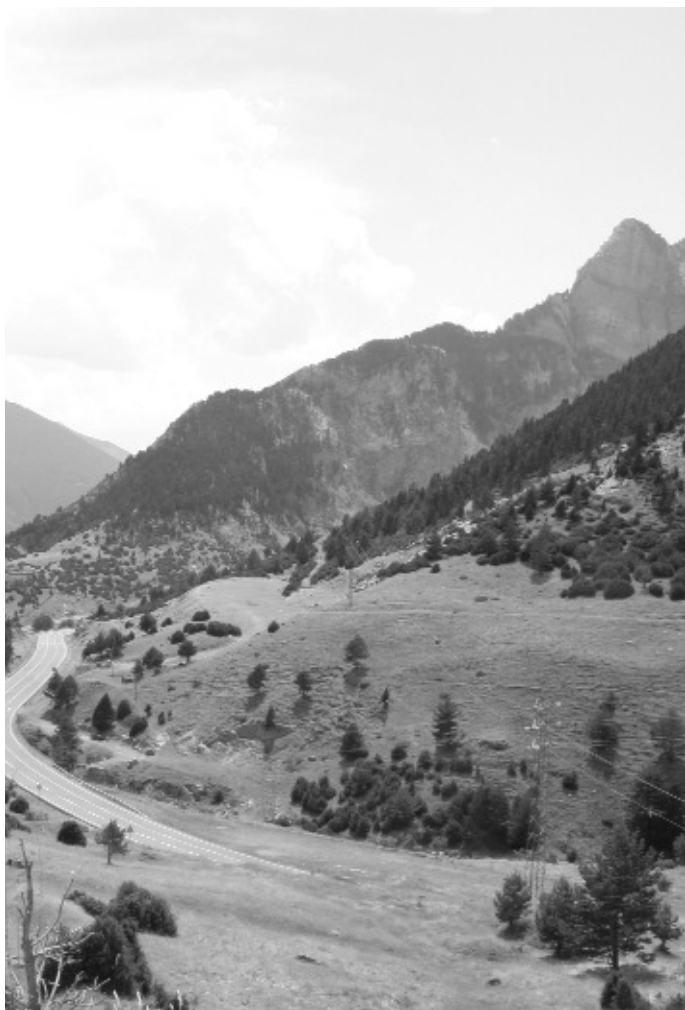
Blick über den Somportpass.

störerische Feuer, das der großen Verwandlung des Eingeweihten vorangeht, wenn er mit dem Überschreiten der Bergkette den großen Reinigungsgang des Jakobsweges beginnt.