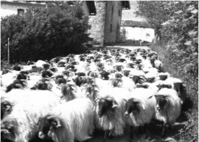
Schafherde bei Roncesvalles.

Für alle Wege, die nach Santiago führen, existiert ein bezaubernder Fundus an Episoden, Merkwürdigkeiten und Ergötlichkeiten. Doch zweifelsohne entspringt der größte Teil der bis heute überlieferten Erfahrungen und Begebenheiten dem unerschöpflichen Kulturstrom des Camino Francés . Aus diesem wurden die unterschiedlichsten Schilderungen für dieses Büchlein gewählt.